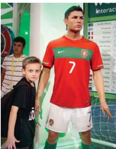
Πρόσφατη επίσκεψη μαθητή των REAL CENTRE OF ENGLISH στο μουσείο κέρινων ομοιωμάτων Madame Tussaud στο Λονδίνο