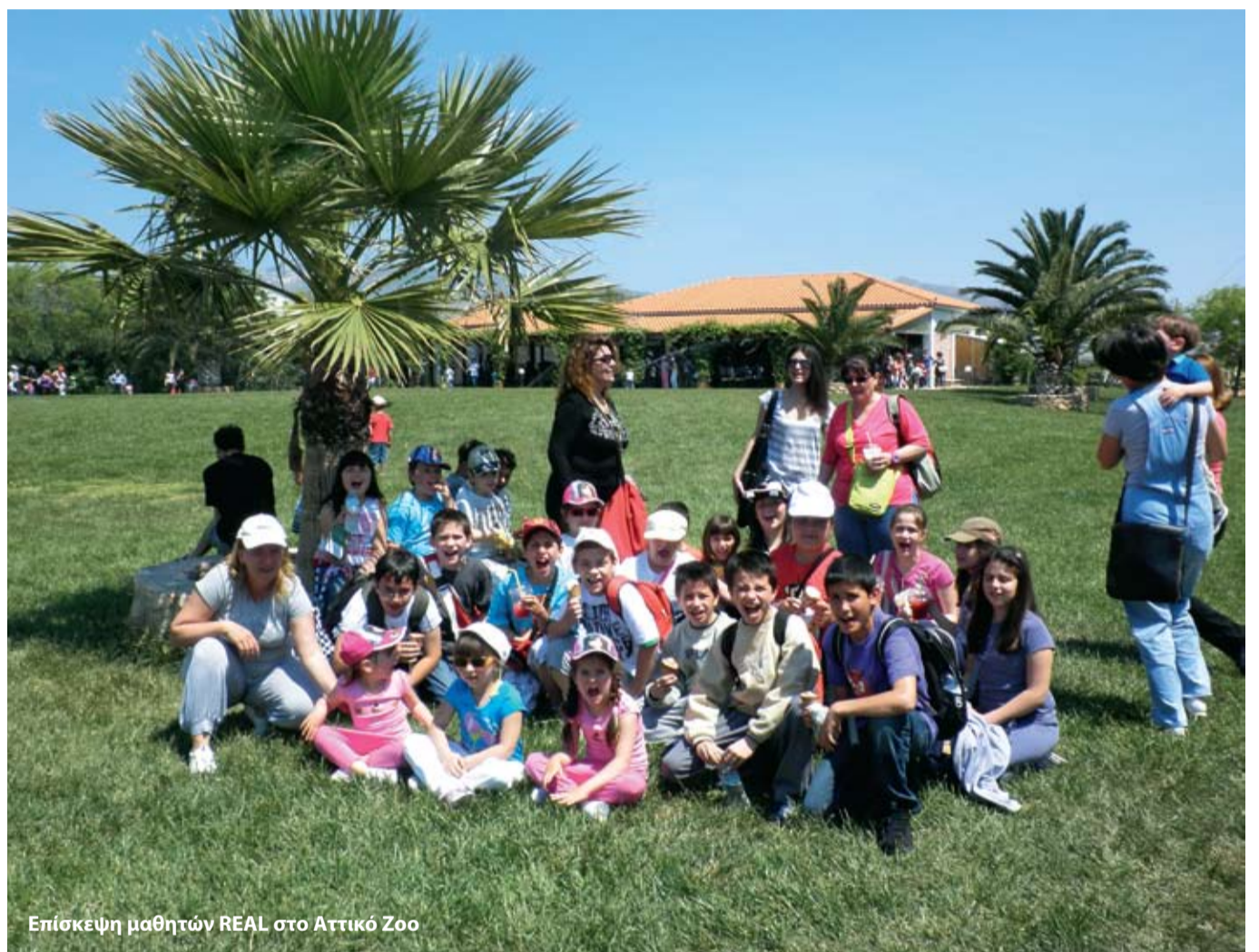
Επίσκεψη μαθητών REAL στο Αττικό Ζoo

Λένε πως κάποιες προσωπικότητες κλείνουν ένα είδους "ραντεβού" με την ιστορία και φροντίζουν να συμπέσουν χρονικά άλλοτε οι ζωές τους και άλλοτε οι ενέργειές τους. Όταν το καλοκαίρι του 1896 ο Pierre de Coubertin αναβίωσε τους Ολυμπιακούς αγώνες στην Ελλάδα θέτοντας τις ανθρωπιστικές αξίες τους στο επίκεντρο του διεθνούς ενδιαφέροντος, τις ίδιες μέρες ένας ερευνητής που έμελλε να βάλει τα παιδιά στο κέντρο της διεθνούς επιστημονικής μελέτης ερχόταν στον κόσμο.