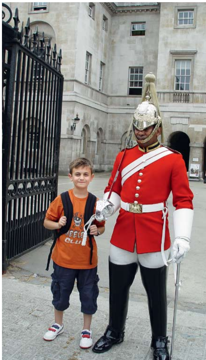
Από πρόσφατη επίσκεψη μαθητή των Real Center of English στην Αγγλία